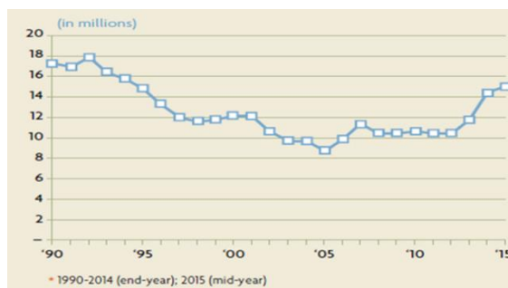
نمودار ۱. روند تعداد آوارگان تحت پوشش کمیساریای عالی پناهندگان طی سال‌های ۱۹۹۰ - ۲۰۱۵ (منبع: سایت کمیساریای عالی امور پناهندگان سازمان ملل به آدرس www.unhcr.org )

این واقعیت وجود دارد که جابه‌جایی اجباری و تطابق با یک کشور و زبان جدید همراه با سایر عوامل استرس‌زای ناشی از مشکلات اجتماعی و اقتصادی و فرهنگی که آوارگان با آن روبه‌رو می‌شوند، می‌تواند بر سلامت روان آنها تأثیرگذار باشد (۱۴). اگرچه تحقیقات مختلف به اهمیت عوامل خطر مرتبط با سلامت روانی پس از بلایا از جمله ویژگی‌های شخصی (از قبیل جنسیت)، عوامل مرتبط با بلایا (از قبیل جراحت و آوارگی) و عوامل محیطی (مثل حمایت اجتماعی) پرداخته‌اند، با این وجود اجماع و اتفاق نظر بر ماهیت، درجه و تداوم اختلالات روانی ناشی از حوادث و بلایا وجود ندارد (۱۵). اما آنچه در این زمینه اهمیت بالایی دارد، توجه به این موضوع است که سلامت روان چیزی فراتر از نبود اختلالات روانی است و ابعاد تأمین رشد و بهداشت روانی فردی و اجتماعی، پیشگیری از ابتلا به اختلال روانی، درمان مناسب و بازتوانی را شامل می‌شود و لذا حفظ و ارتقای آن مثل سلامت جسم به‌ویژه در گروه‌های آسیب‌پذیر حائز اهمیت است (۱۶).