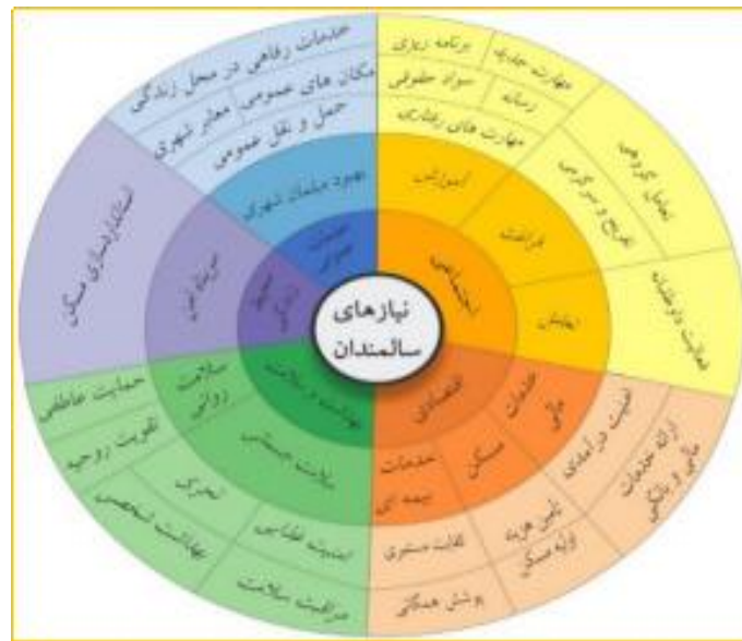
شکل ۲. طبقه‌بندی نیازهای سالمندان

آنان دوجندان می‌شود. این امر نه تنها از منظر ارتقاء کیفیت زندگی و رفاه این گروه جمعیتی حائز اهمیت است، بلکه از منظر کاهش پیامدهای منفی سالمندی در سطوح اجتماعی و کلان نیز نقشی تعیین‌کننده دارد. نتایج پژوهش حاضر، که مبتنی بر تحلیل سه منبع داده شامل استارت‌آپ‌های سالمندی، اسناد تخصصی و مصاحبه با ذی‌نفعان است، می‌تواند چشم‌انداز دقیق‌تر و جزئیات قابل اتکاتری را در اختیار برنامه‌ریزان و سیاست‌گذاران قرار دهد؛ تا با شناختی جامع‌تر از ابعاد گوناگون نیازهای سالمندان، بتوانند اقدامات مؤثرتری در پاسخ به این نیازها در سطوح خرد و کلان طراحی و اجرا کنند.