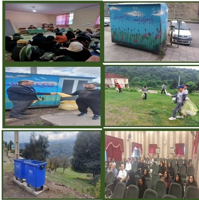
شکل ۲. نمونه هایی از مستندات مداخله تفکیک پسماند از مبدأ (از بالا به پایین به ترتیب از راست به چپ: ۱) راه اندازی غرفه ی بازیافت (۲) مداخله ی آموزشی با حضور زنان خانواده (۳) مداخله ی آموزشی با حضور فرزندان خانواده و برگزاری اردوی دانش آموزی با محوریت جمع آوری پسماندها شده در محیط (۴) دریافت پسماند تفکیک شده و دراختیار گذاشتن کیسه زباله و پمفلت به گروه مداخله (۵) مداخله ی آموزشی با حضور همسران خانواده (۶) نصب سطل زباله در روستا از محل درآمد پسماند جمع آوری شده )