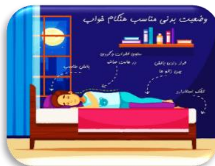
شکل ۱. محتوای آموزشی گروه شاهد

به منظور ارزیابی اثربخشی مداخله‌ی آموزشی، نمرات پس‌آزمون دو گروه مداخله و شاهد با استفاده از آزمون تی مستقل مورد مقایسه قرار گرفتند. میانگین نمره‌ی گروه مداخله با 4/11 نمره افزایش، پس از آموزش به 12/54 رسید که معادل 48/7 درصد افزایش نسبت به پیش از مداخله است. در مقابل، میانگین گروه شاهد تقریباً بدون تغییر باقی ماند ( p = 0/51 ). نتایج نشان داد که تفاوت بین دو گروه از نظر آماری معنادار ( p < 0/001 ) و بیانگر بهبود قابل توجه سطح آگاهی گروه مداخله پس از آموزش بوده که مؤید اثربخشی مداخله آموزشی طراحی شده می‌باشد. مقایسه میانگین نمرات KidSEA برای هر دو گروه، به تفکیک زمان قبل و بعد از اجرای مداخله در جدول ۲ خلاصه شده است.