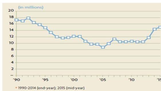
نمودار ۱. روند تعداد آوارگان تحت پوشش کمیساریای عالی پناهندگان طی سال‌های ۱۹۹۰ - ۲۰۱۵ (منبع: سایت کمیساریای عالی امور پناهندگان سازمان ملل به آدرس www.unhcr.org )

این واقعیت وجود دارد که جابه‌جایی اجباری و تطابق با یک کشور و زبان جدید همراه با سایر عوامل استرس‌زای ناشی از مشکلات اجتماعی و اقتصادی و فرهنگی که آوارگان با آن روبه‌رو می‌شوند، می‌تواند بر سلامت روان آنها تأثیرگذار باشد (۱۴). اگرچه تحقیقات مختلف به اهمیت عوامل خطر مرتبط با سلامت روانی پس از بلایا از جمله ویژگی‌های شخصی (از قبیل جنسیت)، عوامل مرتبط با بلایا (از قبیل جراحت و آوارگی) و عوامل محیطی (مثل حمایت اجتماعی) پرداخته‌اند، با این وجود اجماع و اتفاق نظر بر ماهیت، درجه و تداوم اختلالات روانی ناشی از حوادث و بلایا وجود ندارد (۱۵). اما آنچه در این زمینه اهمیت بالایی دارد، توجه به این موضوع است که سلامت روان چیزی فراتر از نبود اختلالات روانی است و ابعاد تأمین رشد و بهداشت روانی فردی و اجتماعی، پیشگیری از ابتلا به اختلال روانی، درمان مناسب و بازتوانی را شامل می‌شود و لذا حفظ و ارتقای آن مثل سلامت جسم به‌ویژه در گروه‌های آسیب‌پذیر حائز اهمیت است (۱۶).